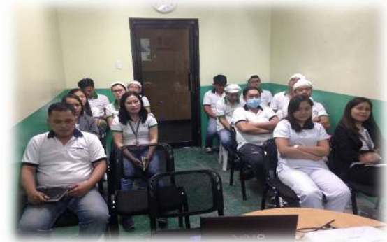
※CSI（フィリピン・セブ工場）