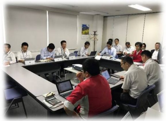
東京本社受講風景