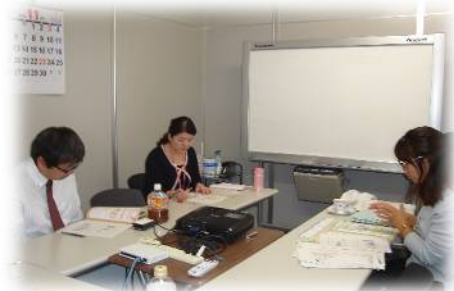
関西営業所受講風景