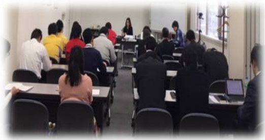
東京本社受講風景