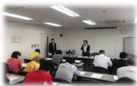
東京本社受講風景

➤ 講師：淀川区保健福祉センター 保健師(大阪) 練馬区豊玉保健相談所 保健師、管理栄養士(東京)